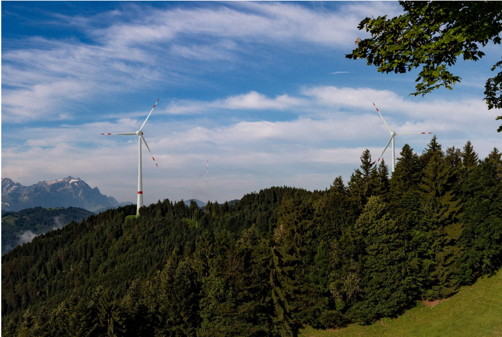
Aufnahme vom 28.7.2016, 08:10, Blickrichtung 223°, Rotorstellung: 60°