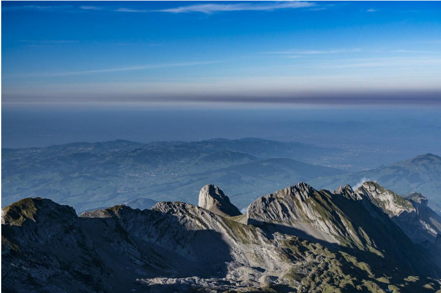
Aufnahme vom 24.9.2016, 17:43, Blickrichtung 39°, Rotorstellung: 60°