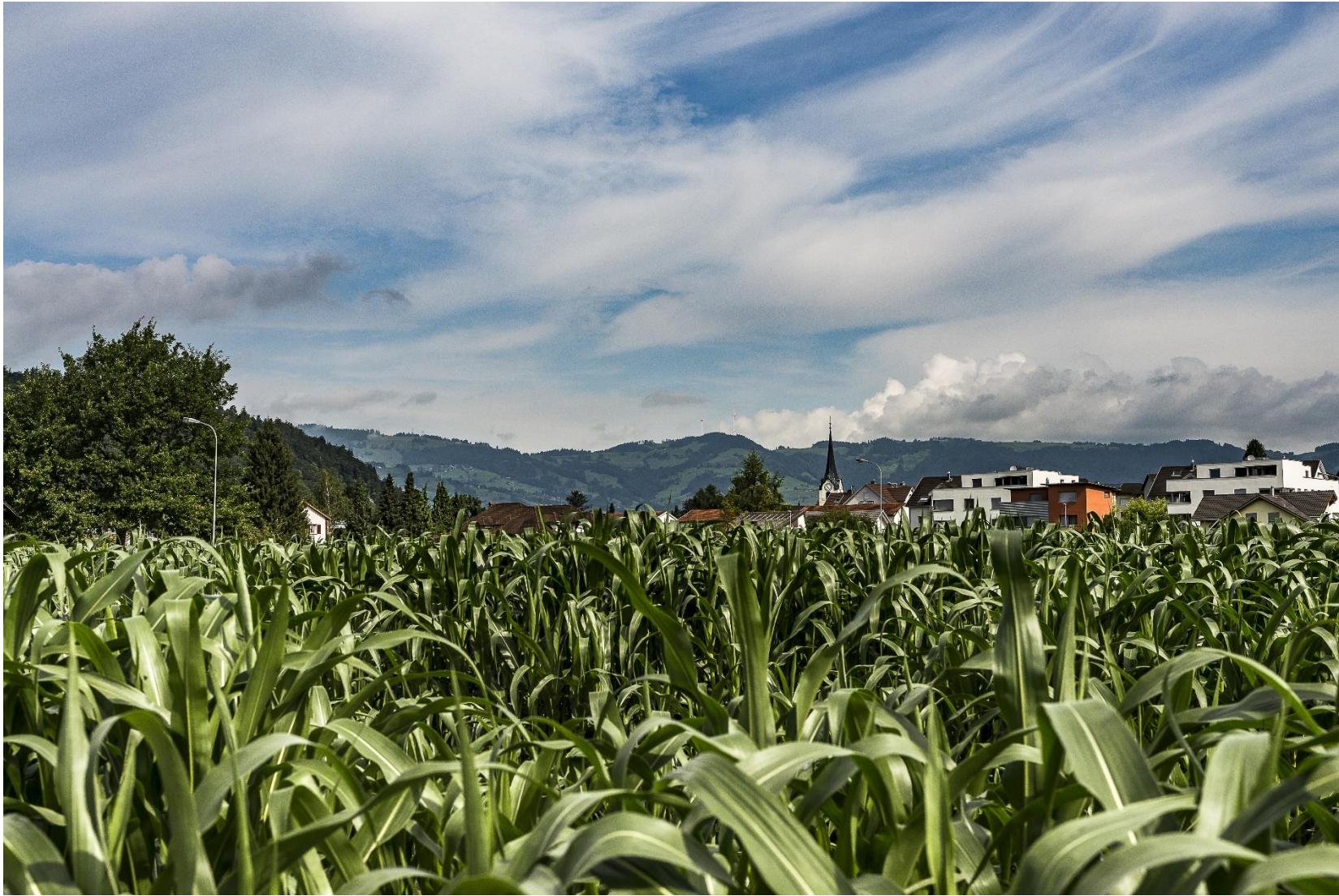
Aufnahme vom 28.7.2016, 10:24, Blickrichtung 340°, Rotorstellung: 180°