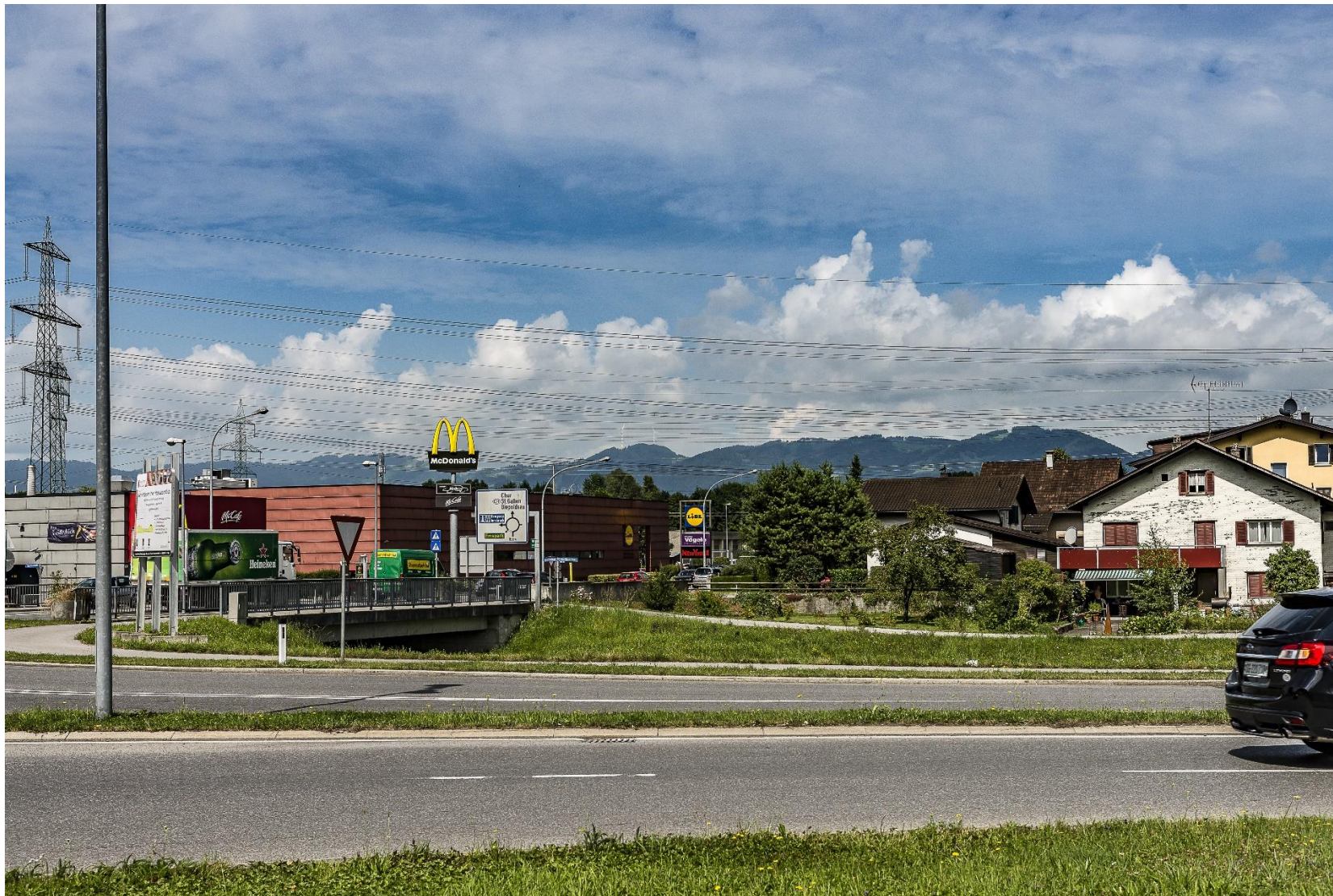
Aufnahme vom 28.7.2016, 11:14, Blickrichtung 287°, Rotorstellung: 270°