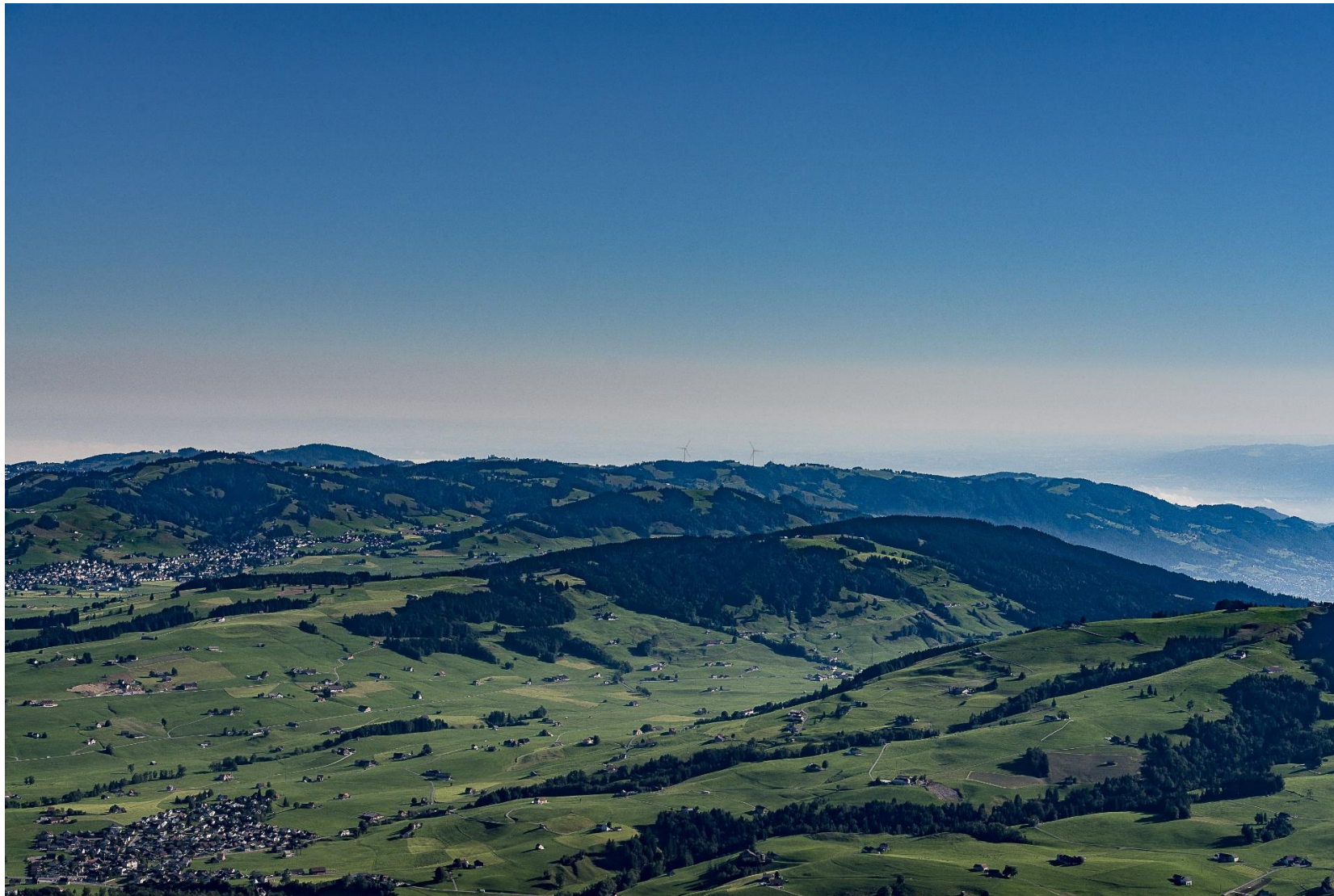
Aufnahme vom 26.8.2016, 09:12, Blickrichtung 30°, Rotorstellung: 180°