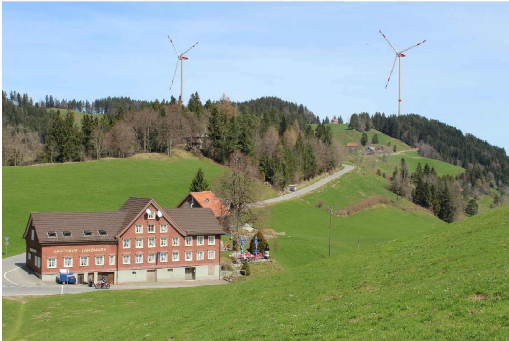
Aufnahme vom 14.4.2018, 12:25, Blickrichtung 40°, Windrichtung: -90° (JH Wind)