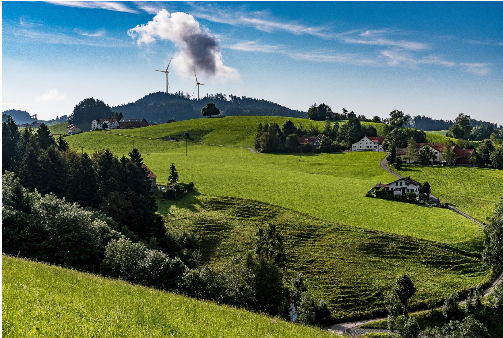
Aufnahme vom 27.7.2016, 08:57, Blickrichtung 124°, Rotorstellung: 270°