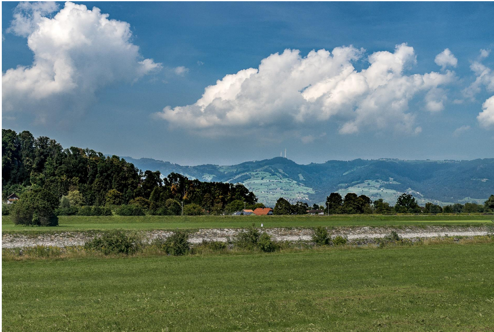
Aufnahme vom 2.9.2016, 12:49, Blickrichtung 322°, Rotorstellung: 180°