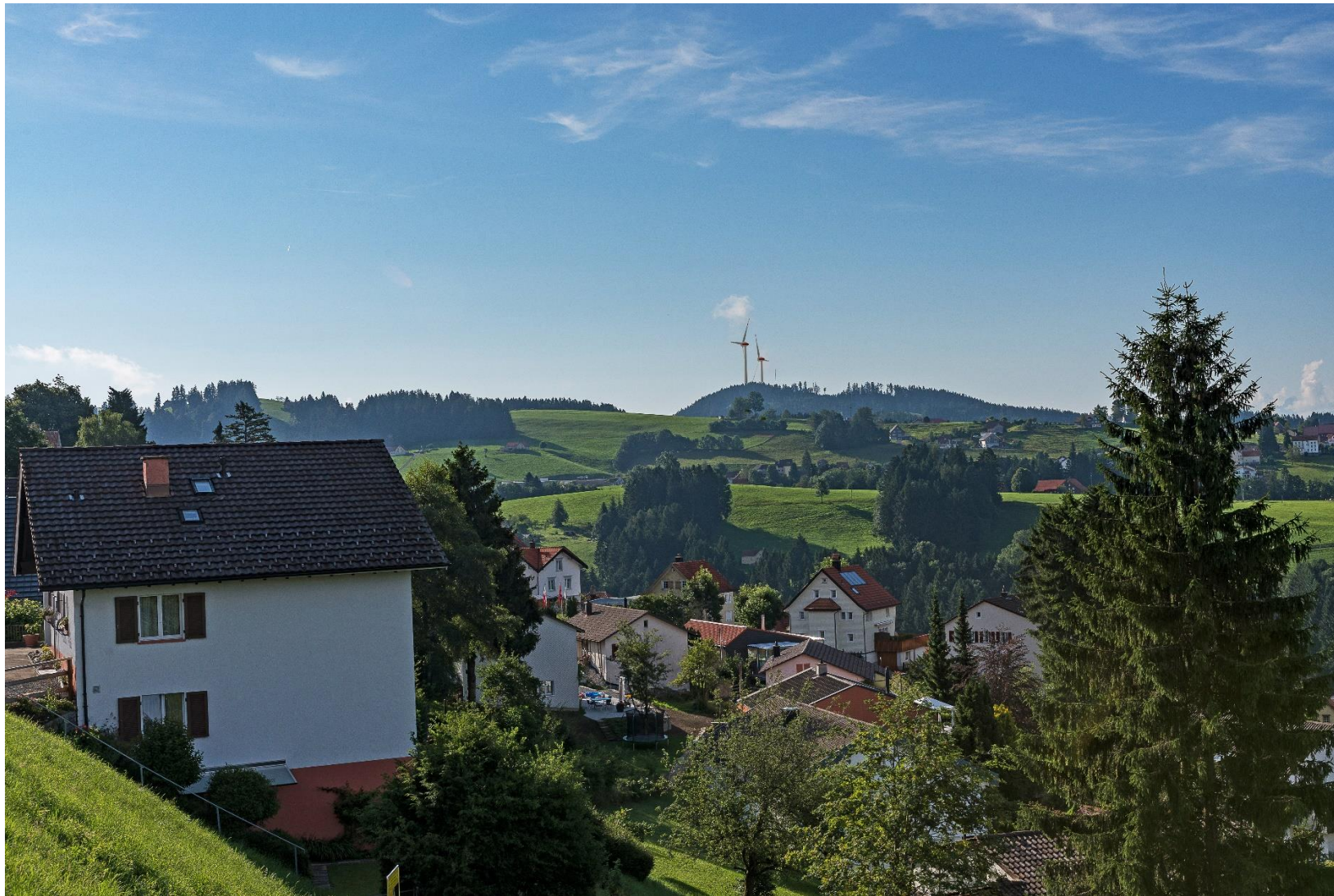
Aufnahme vom 28.7.2016, 08:33, Blickrichtung 128°, Rotorstellung: 180°