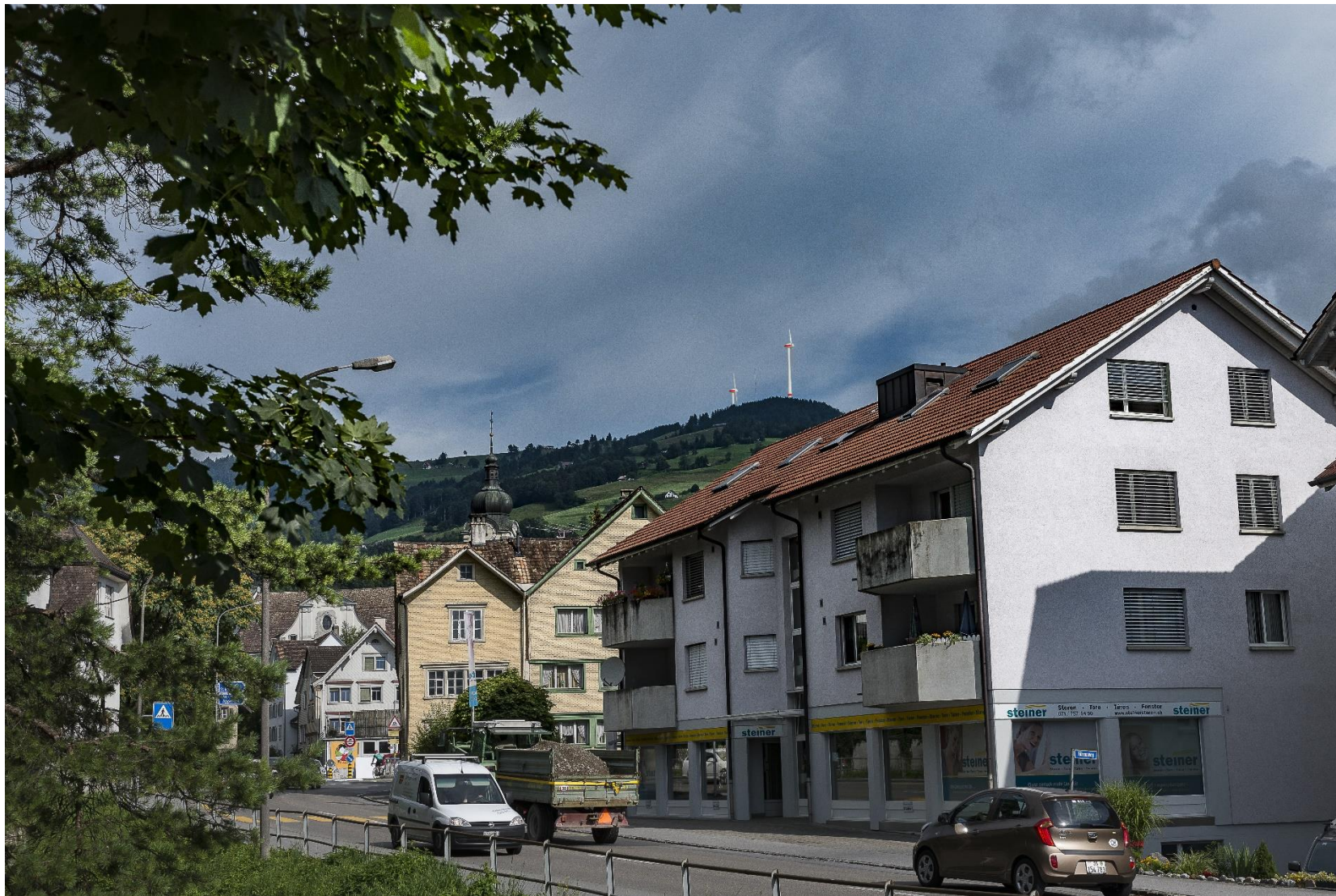
Aufnahme vom 28.7.2016, 09:44, Blickrichtung 329°, Rotorstellung: 180°