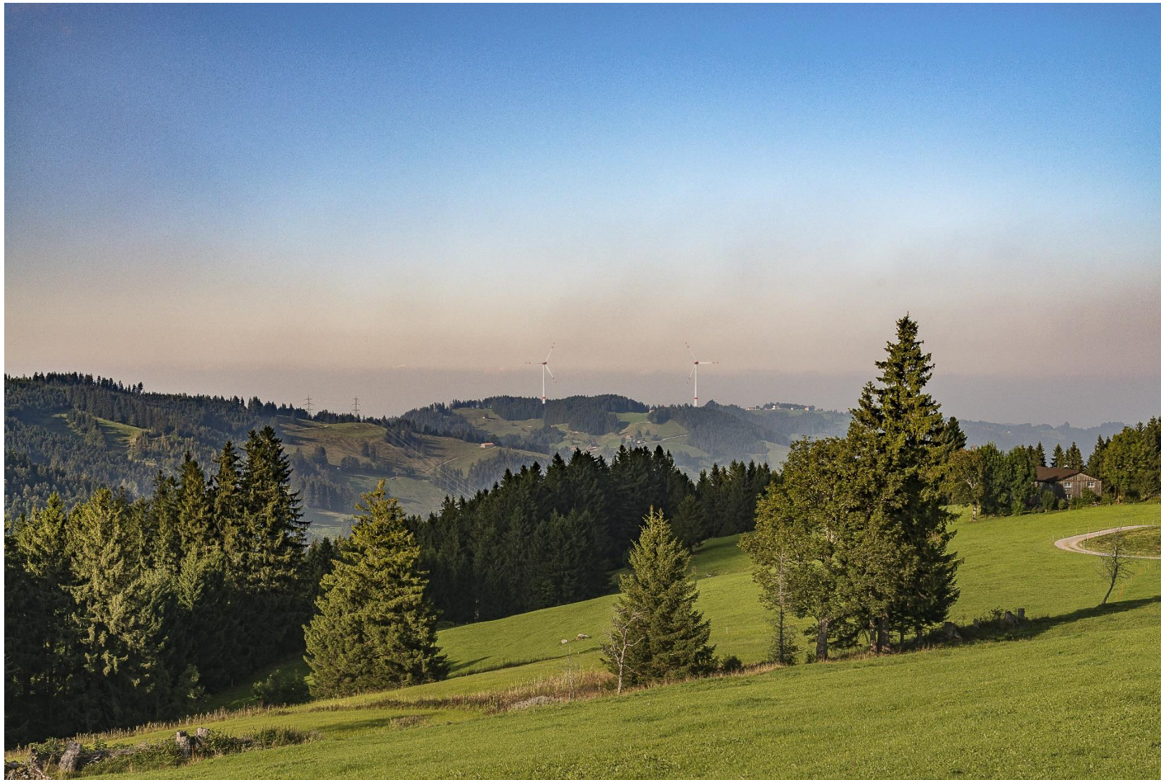
Aufnahme vom 31.8.2016, 17:36, Blickrichtung 32°, Rotorstellung: 180°