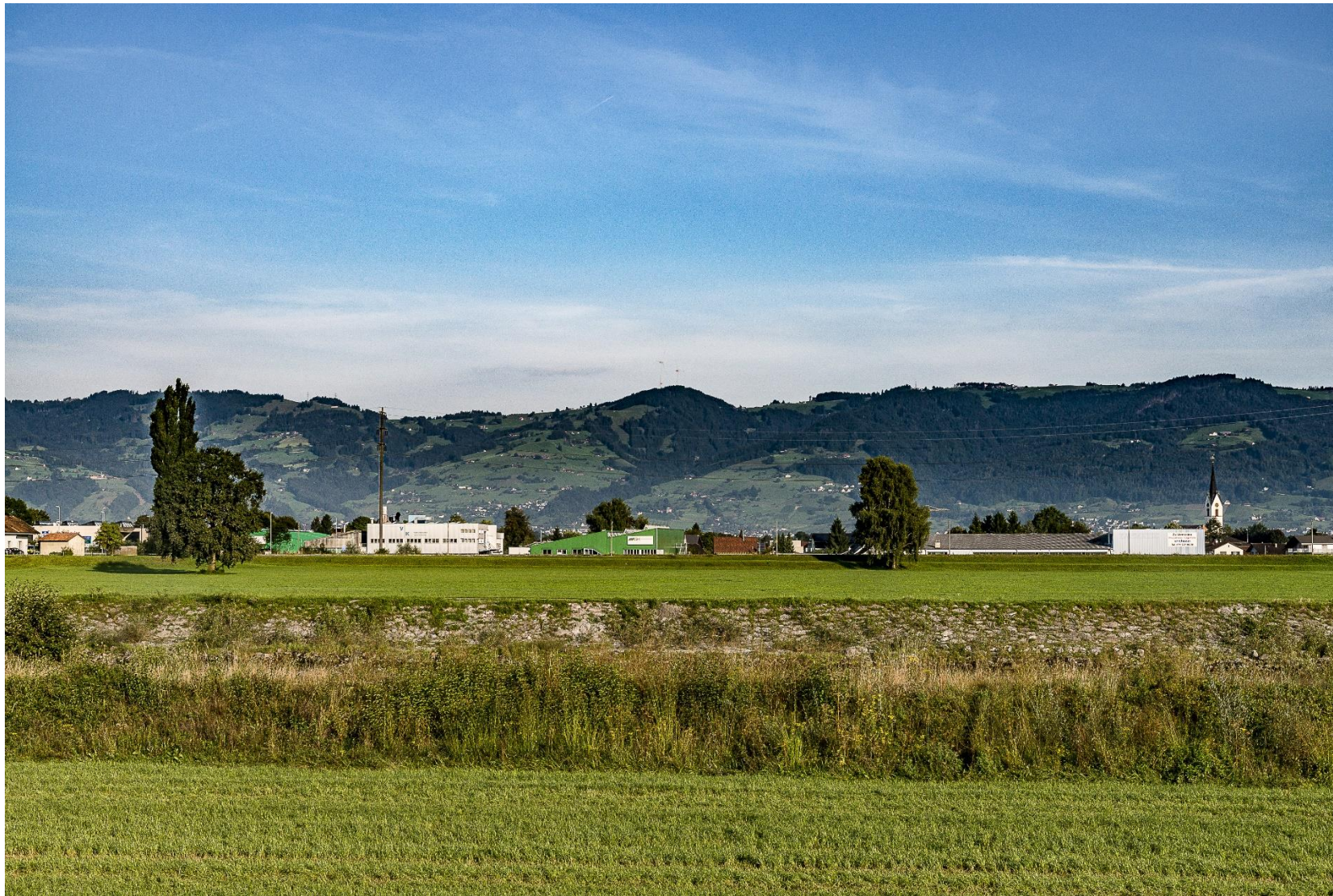
Aufnahme vom 2.9.2016, 08:24, Blickrichtung 306°, Rotorstellung: 180° (Meteotest)