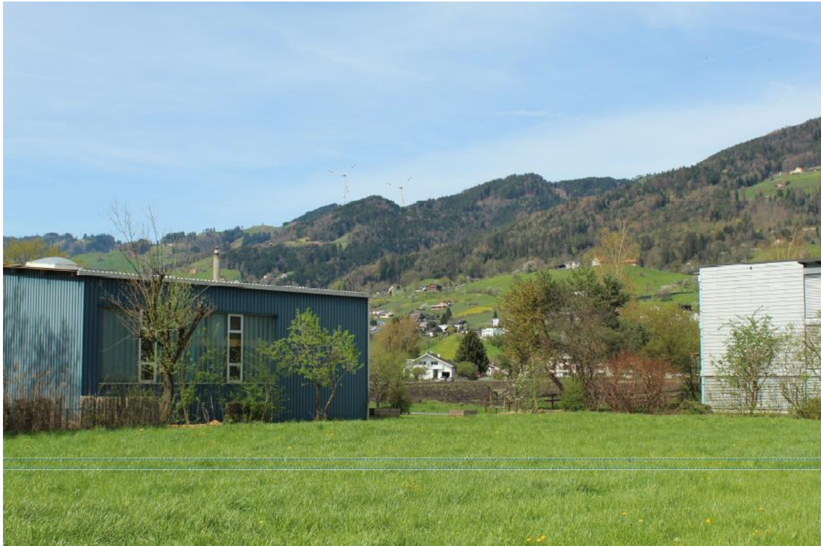
Aufnahme vom 14.4.2018, 11:14, Blickrichtung 286°, Rotorstellung: -90°