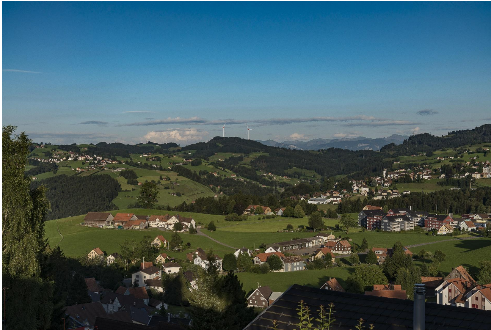
Aufnahme vom 8.8.2016, 19:29, Blickrichtung 104°, Rotorstellung: 270°