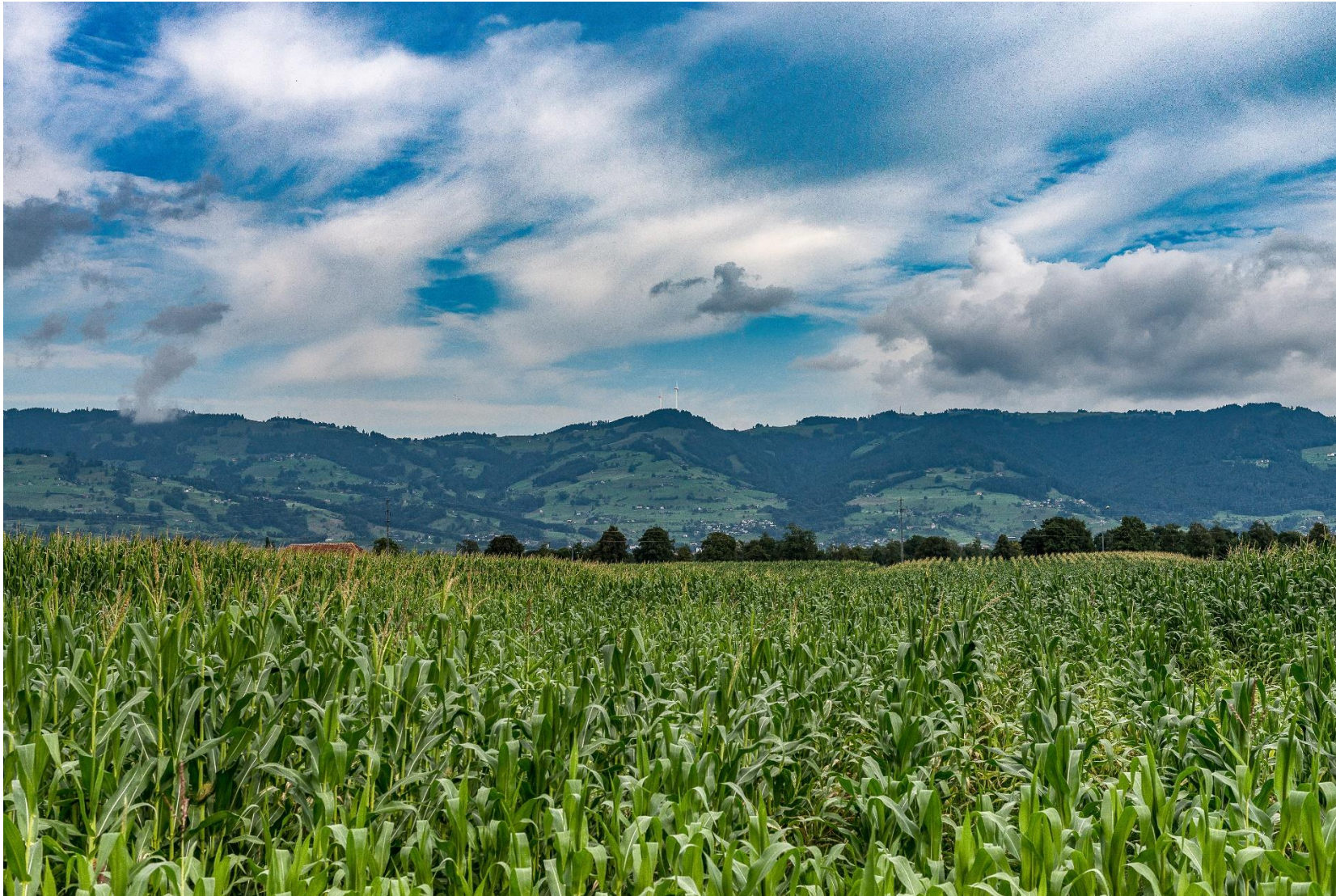
Aufnahme vom 28.7.2016, 10:03, Blickrichtung 326°, Rotorstellung: 180°