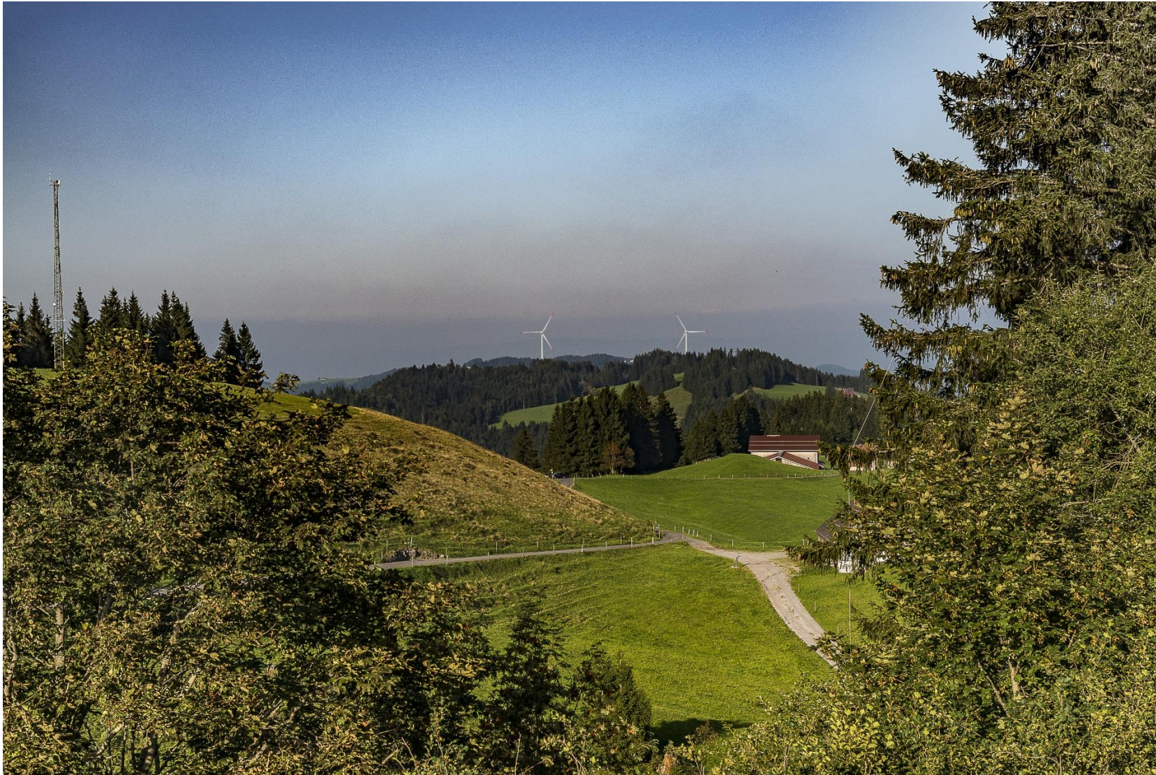
Aufnahme vom 31.8.2016, 17:57, Blickrichtung 55°, Rotorstellung: 60°