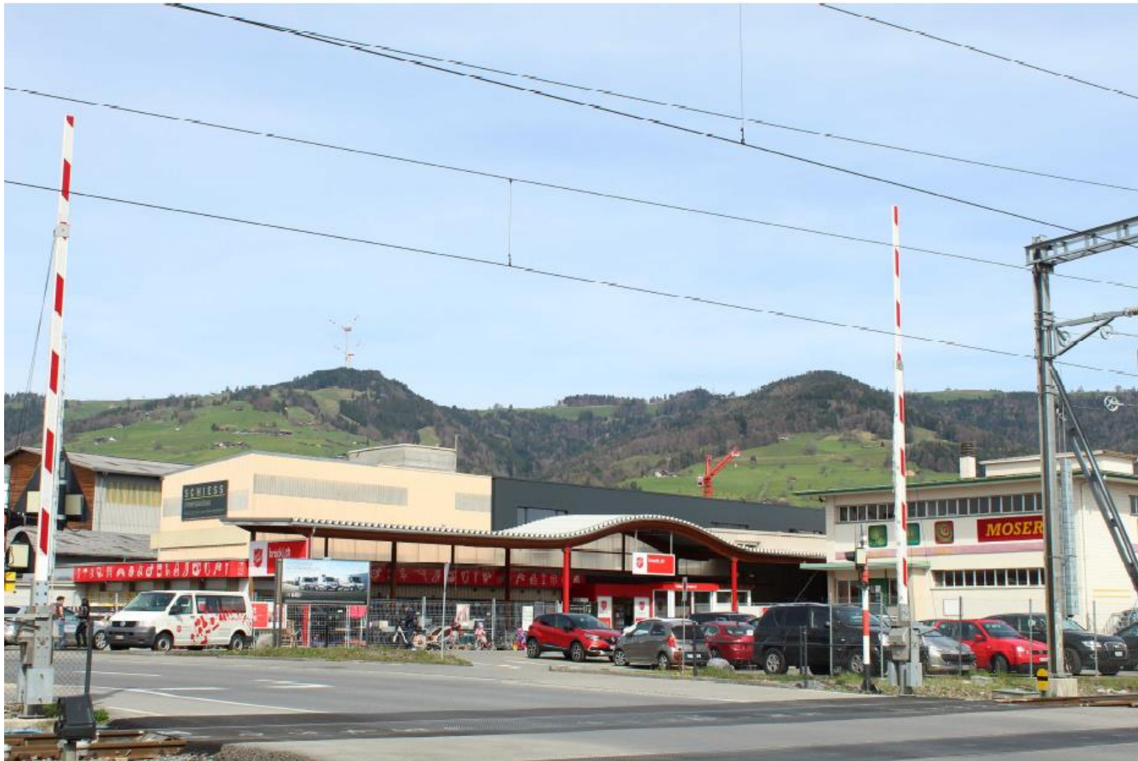
Aufnahme vom 14.4.2018, 10:31, Blickrichtung 328°, Windrichtung: -90° (JH Wind)