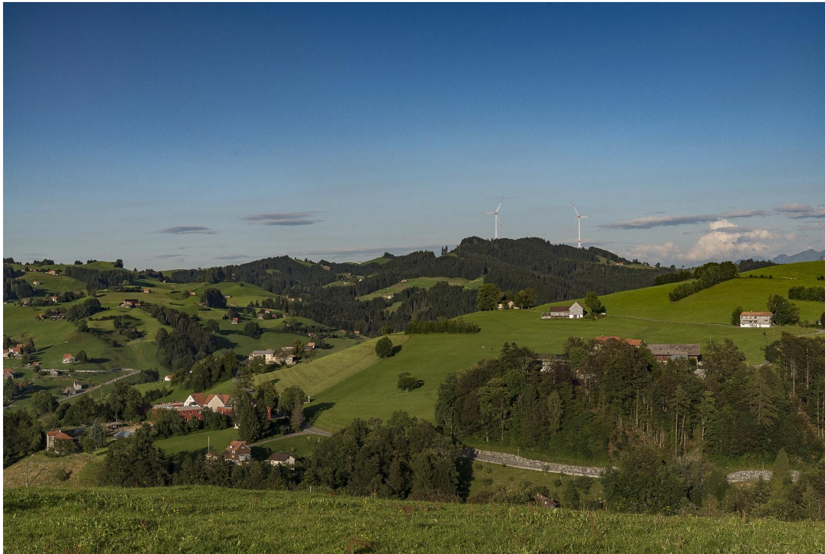
Aufnahme vom 8.8.2016, 19:18, Blickrichtung 820°, Rotorstellung: 60° (Meteotest)