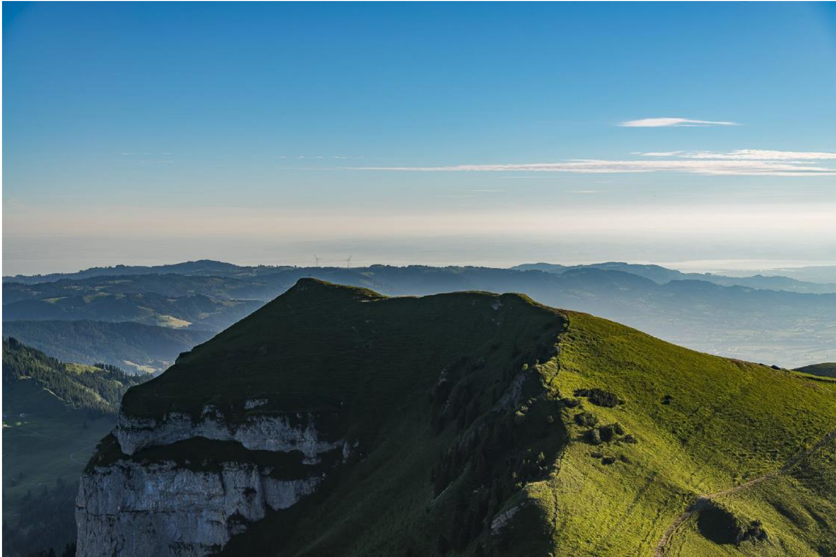
Aufnahme vom 10.7.2016, 06:45, Blickrichtung 16°, Rotorstellung: 180°