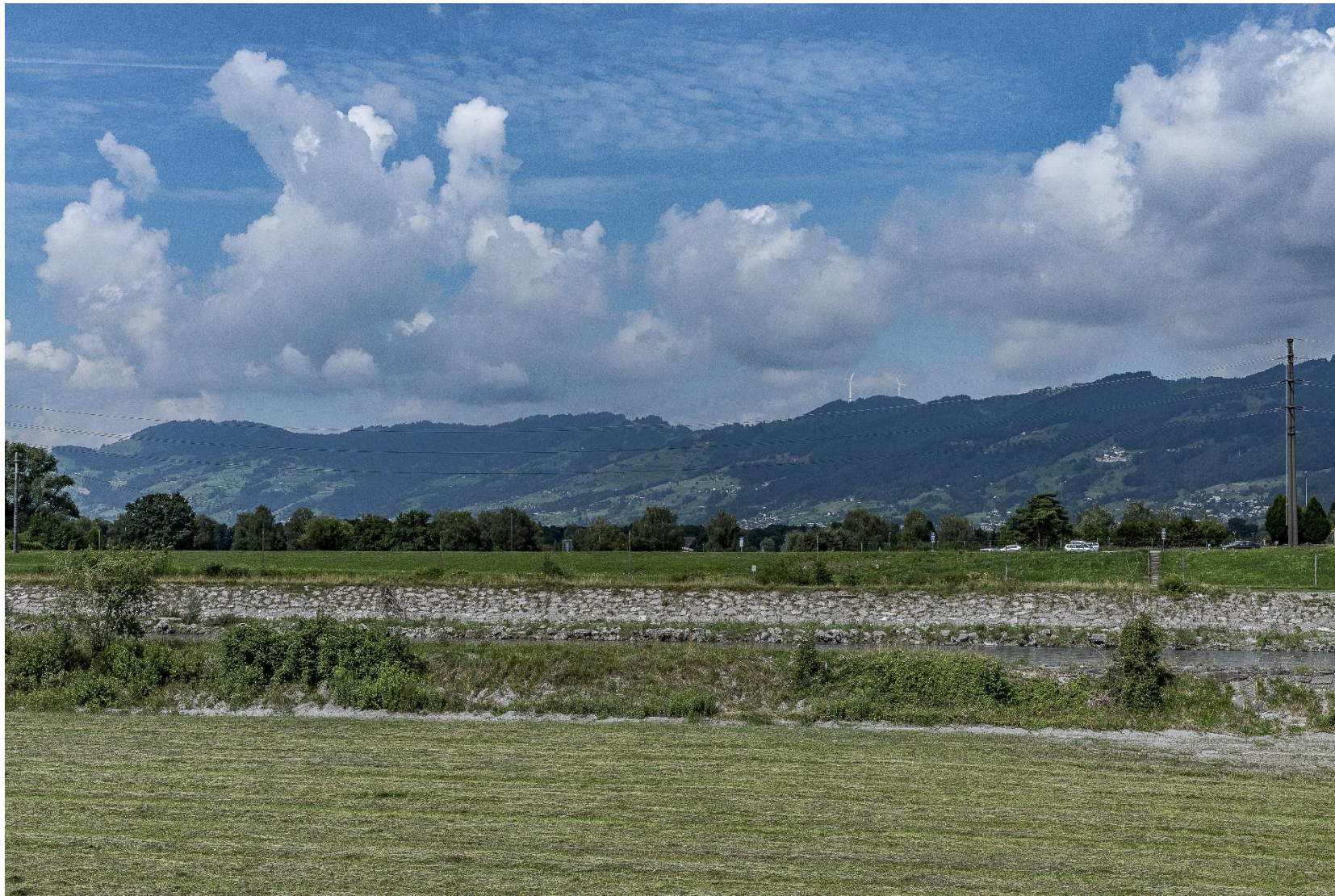
Aufnahme vom 28.7.2016, 11:30, Blickrichtung 273°, Rotorstellung: 270°