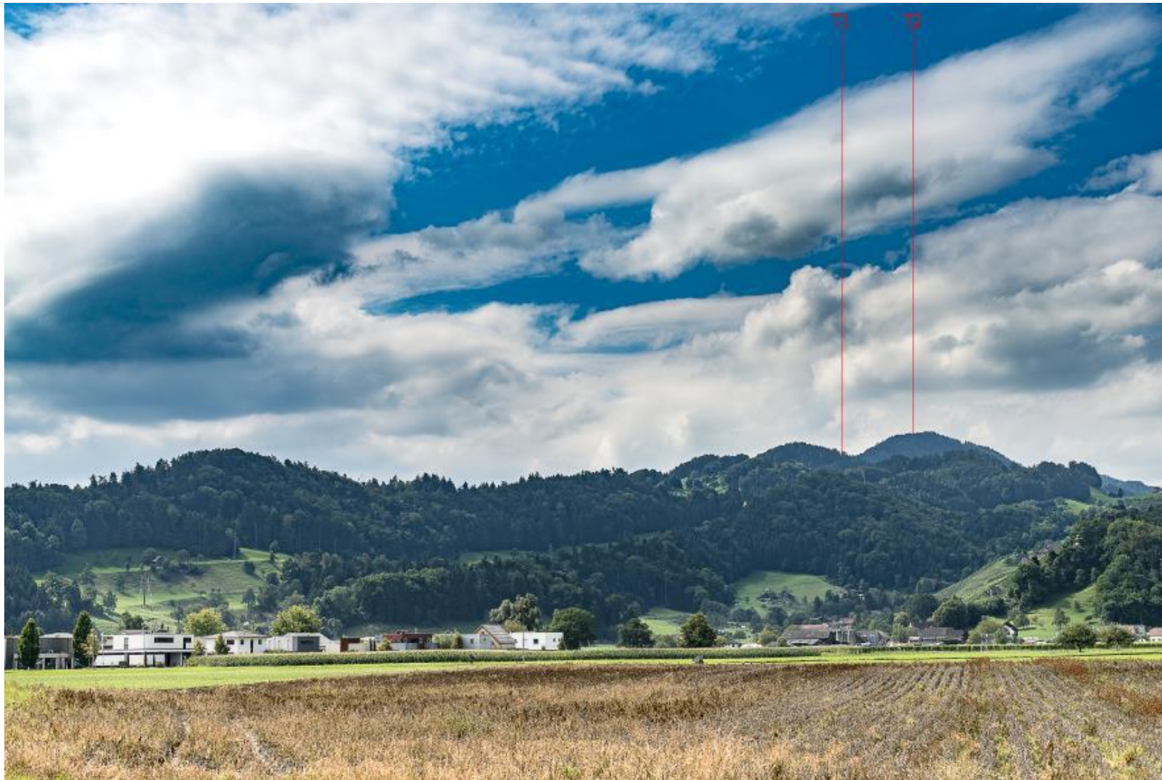
Aufnahme vom 30.8.2016, 13:41, Blickrichtung 246°, Rotorstellung: 60°, nicht sichtbar