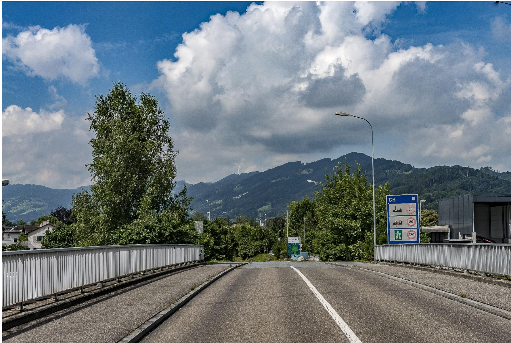
Aufnahme vom 28.7.2016, 11:44, Blickrichtung 268°, Rotorstellung: 270°