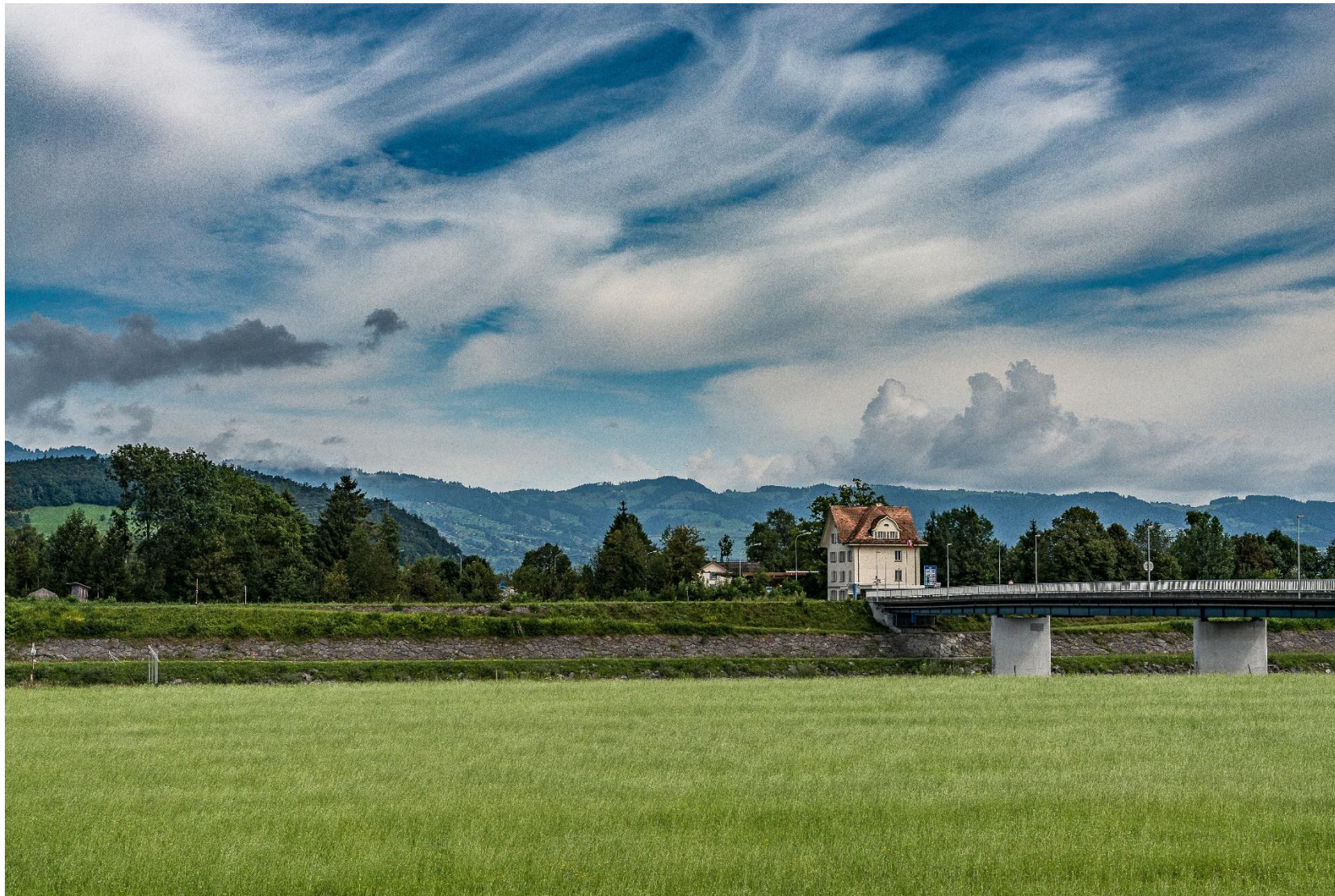
Aufnahme vom 28.7.2016, 10:19, Blickrichtung 342°, Rotorstellung: 180°