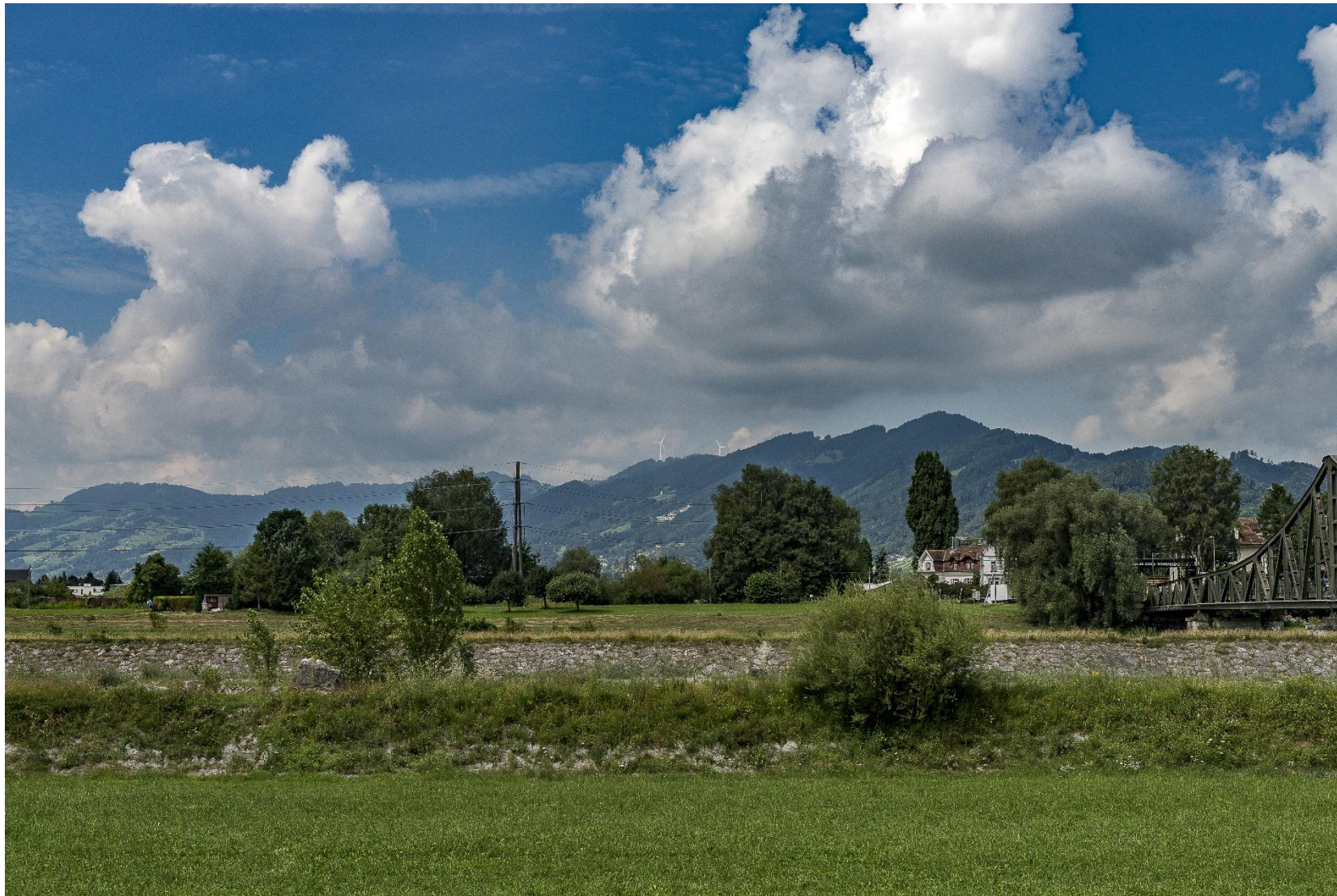
Aufnahme vom 28.7.2016, 11:39, Blickrichtung 267°, Rotorstellung: 60°